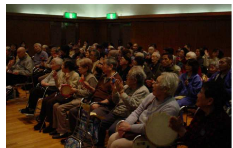
介護老人保険施設あおやぎ苑にて、第五商業高等学校生徒によるクリスマスコンサート