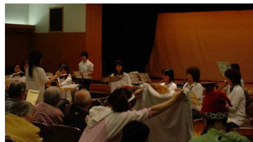
社会福祉会館にて、国立音楽大学附属高等学校生徒によるクリスマスコンサート

市内の各学校訪問をすることがご縁となり、2つのSクラブを誕生させることができました。2つのSクラブが成長し、今日では毎年高齢者施設を慰問して音楽演奏を行い、施設や地域の方からも感謝されています。こうした若者の社会参加を推進することができるのも、ユースフォーラムというコミュニケーションの場があるからです。